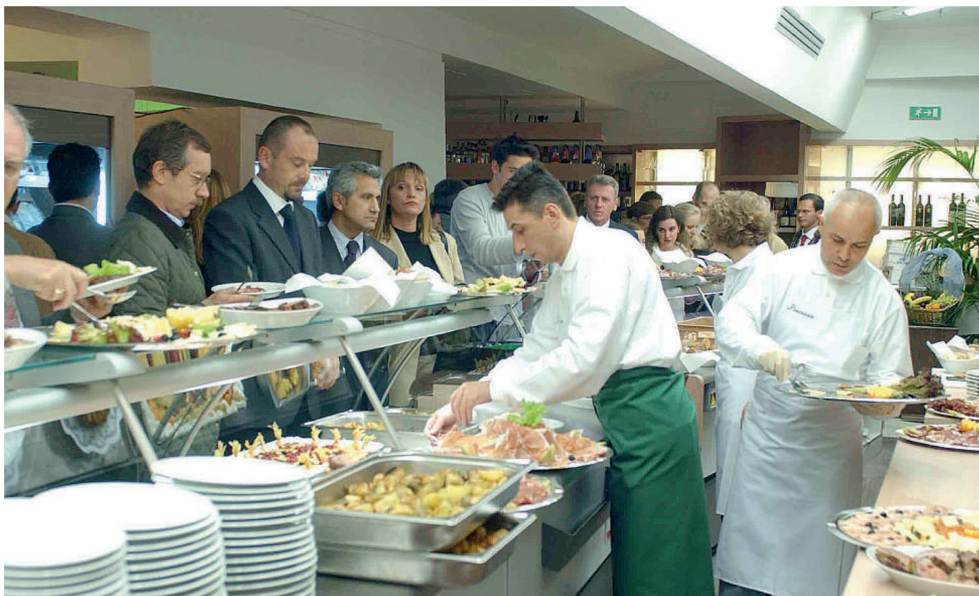
Uno dei tanti momenti promozionali delle tipicità piacentine a cura del Consorzio Piacenza Alimentare

«Si punta ad organizzare diversi prodotti turistici enogastronomici, in particolare con la rete "Assapora Piacenza" costituita da produttori agricoli, agroalimentari ed industrie di trasformazione. Si organizzeranno itinerari turistici enogastronomici, con visita ai luoghi di produzione e trasformazione agroalimentare. Il Consorzio Piacenza Alimentare pianificherà e realizzerà un programma di visite tematiche gestite direttamente dal Consorzio attraverso "Assa-