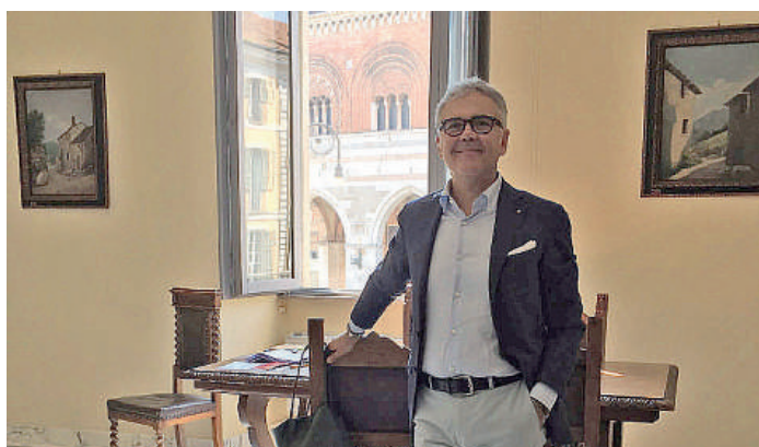
Alfredo Parietti, presidente della Camera di Commercio