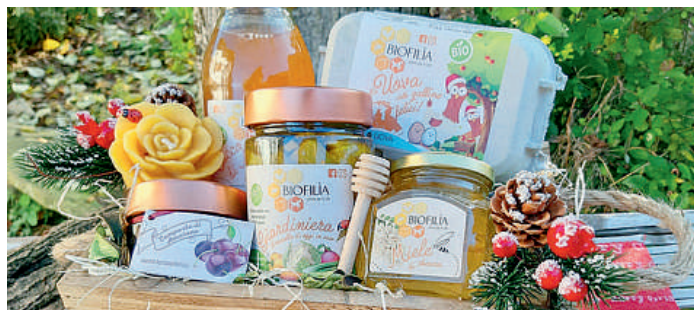
La cassetta regalo preparata dall'azienda Biofilia di Sariano