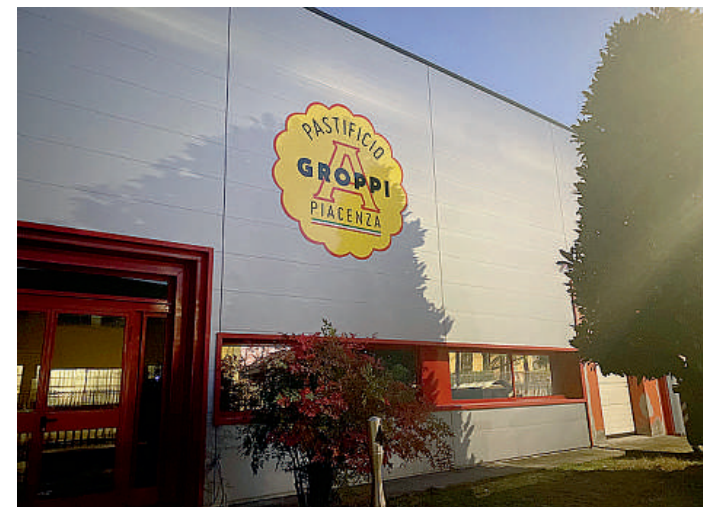
La nuova sede del Pastificio Groppi in via Fontana