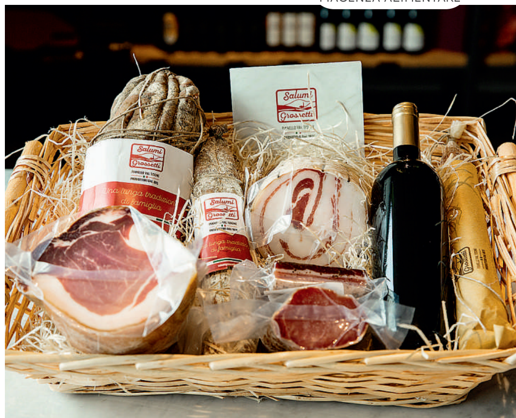
Due cesti natalizi del Salumificio Grossetti di Stra e (sotto) del Salumificio La Rocca di Castellarquato

In tempi di Covid e in vista di festività che dovranno essere celebrate sobriamente, quello a cui non si può rinunciare è comunque una tavola natalizia sulla quale trionfano i nostri meravigliosi salumi piacentini. Due importanti realtà come La Rocca e Grossetti stanno predisponendo i ghiotti cesti-regalo con tutte le eccellenze Dop (e non solo) del territorio ma anche la loro ordinazione on-line e consegna con servizio delivery. Lo storico salumificio di Castellarquato ha predisposto un portale e-commerce dove poter trovare e acquistare on-line tutti i salumi della tradizione piacentina. «Abbiamo creato un packaging accattivante studiato per trasmettere la qualità e il valore dei nostri salumi, uniti alla valorizzazione del territorio - spiegano in azienda - sulle confezioni e le etichette risaltano le immagini del territorio e in particolare del borgo medioevale di Castell'Arquato. Le proposte prevedono i 3 magnifici salumi DOP Piacentini (coppa, salame e pancetta), i salumi regali come Culatello, la Culatta e i fiocchi di spalla e prosciutto, e tutti gli altri salami tradizionali piacentini che possono essere accompagnati dai Vini dei colli piacentini, da prodotti a base di tartufi e fun-